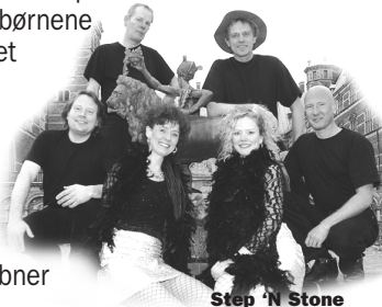
Step N Stone

Tak for i år og på gensyn 29. og 30. april 2006